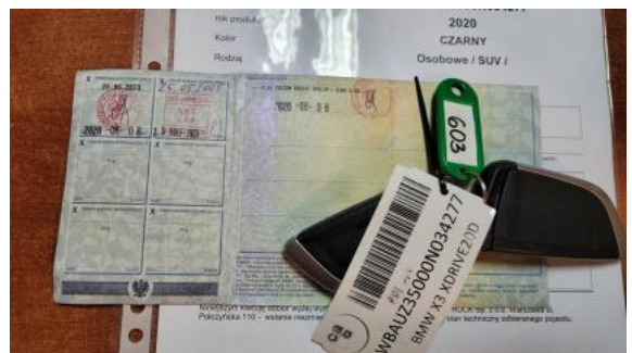
Fot. 32 Dow. Rej. Str.2 i klucze