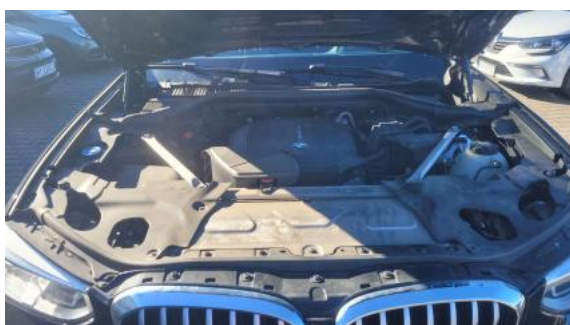
Fot. 23 Komora silnika