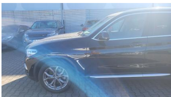
Fot. 11 Bok lewy z przodu