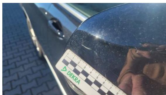
Fot. 40 Lusterko zew P - Rysa/odprysk 1