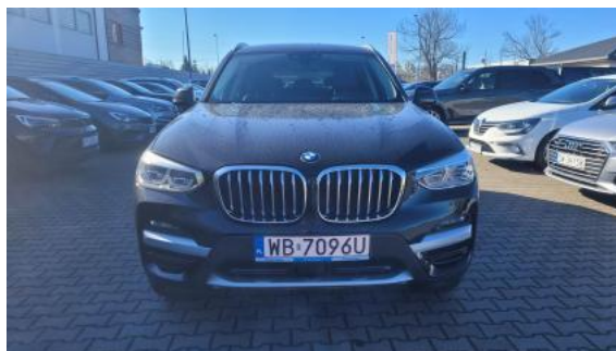
Fot. 2 Przód