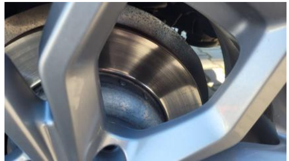
Fot. 30 Tarcza hamulcowa tylna lewa