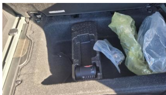
Fot. 36 Zestaw naprawczy koła