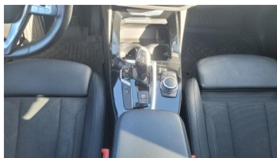
Fot. 20 Tunel środkowy