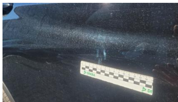
Fot. 38 Drzwi tylne P - Rysa/odprysk 1