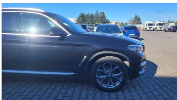
Fot. 5 Bok prawy z przodu