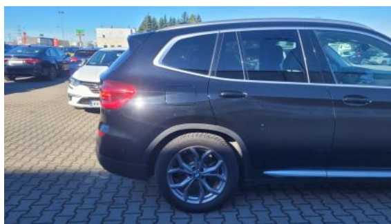
Fot. 6 Bok prawy z tyłu