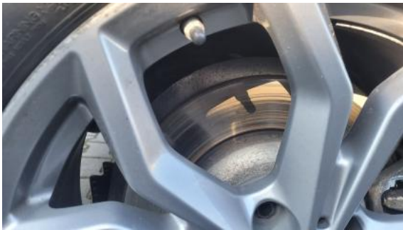
Fot. 29 Tarcza hamulcowa tylna prawa