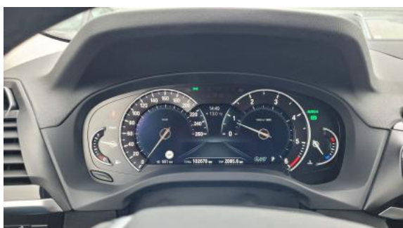
Fot. 15 Zestaw wskaźników - przebieg