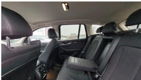
Fot. 17 Widok przez otwarte drzwi tylne lewe