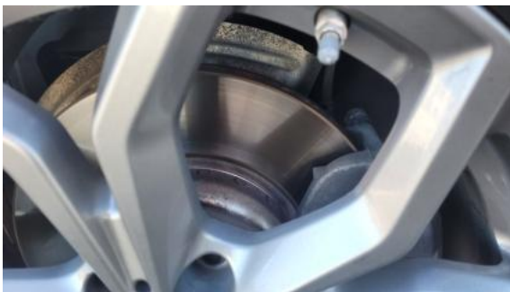
Fot. 27 Tarcza hamulcowa przednia lewa