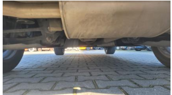
Fot. 26 Spód pojazdu tył