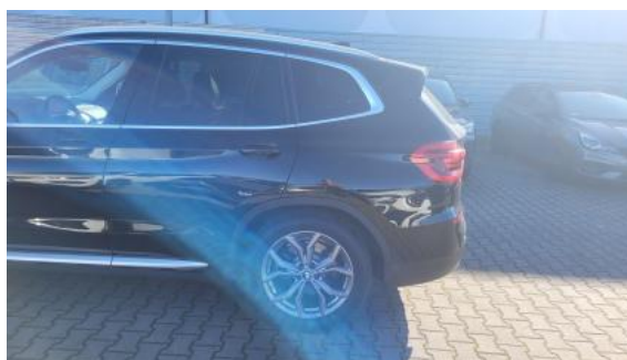
Fot. 10 Bok lewy z tyłu