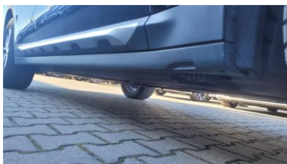
Fot. 4 Próg prawy (widok od przodu)