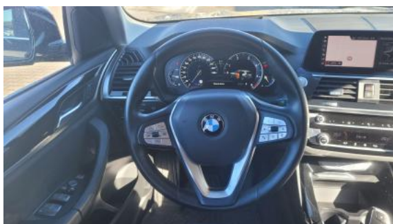
Fot. 21 Kierownica (na wprost)