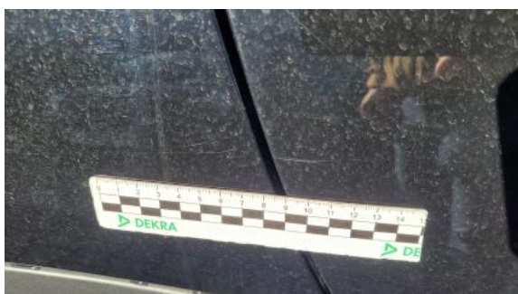
Fot. 39 Drzwi tylne P - Rysa/odprysk 2