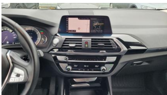
Fot. 19 Konsola środkowa