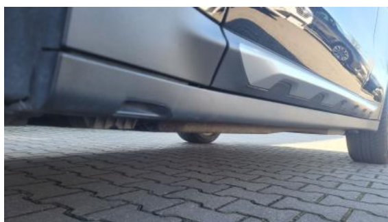
Fot. 12 Próg lewy (widok od przodu)