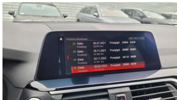
Fot. 34 Książka serwisowa – ostatni przegląd