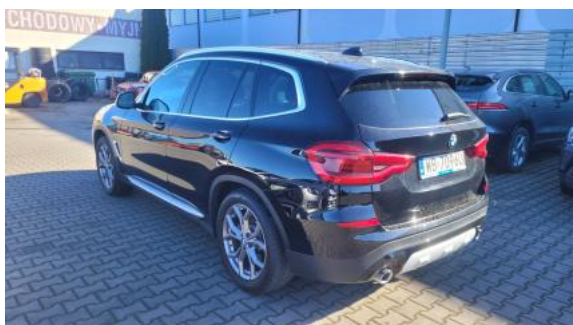
Fot. 9 Przekątna tylna lewa