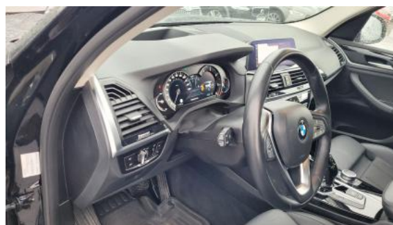
Fot. 22 Kierownica z lewej strony