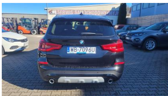
Fot. 8 Tył