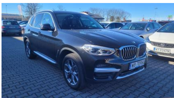
Fot. 3 Przekątna przednia prawa