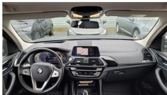
Fot. 18 Widok z tylnej kanapy na deskę rozdzielczą