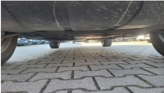
Fot. 25 Spód pojazdu przód