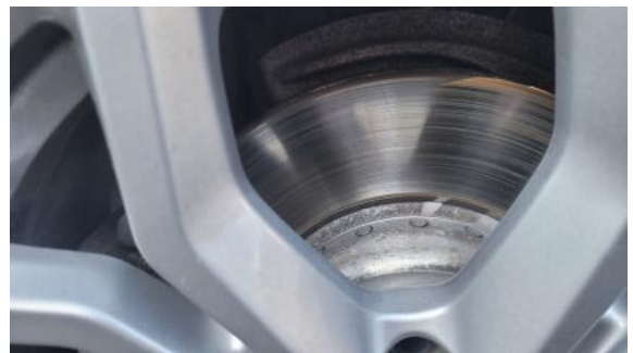
Fot. 28 Tarcza hamulcowa przednia prawa