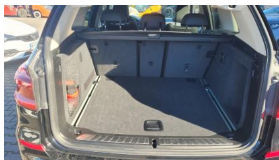
Fot. 24 Bagażnik