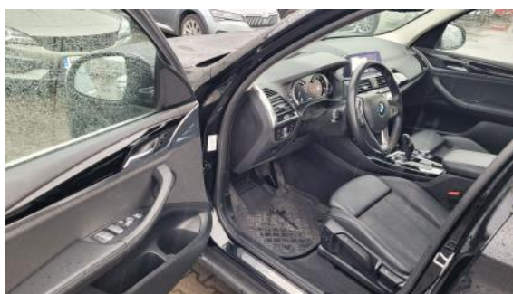
Fot. 16 Widok przez otwarte drzwi przednie lewe