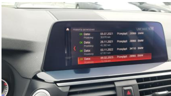
Fot. 33 Książka serwisowa – dane