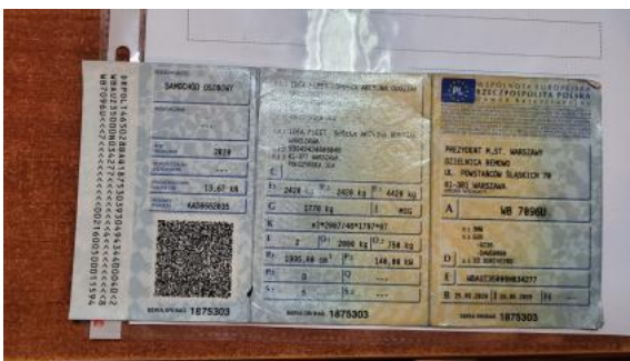
Fot. 31 Dowód rej. Str. 1