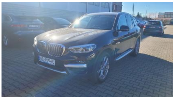
Fot. 1 Przekątna przednia lewa