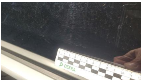
Fot. 37 Drzwi przednie P - Rysa/odprysk 1