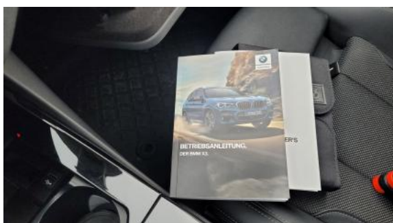
Fot. 35 Instrukcje